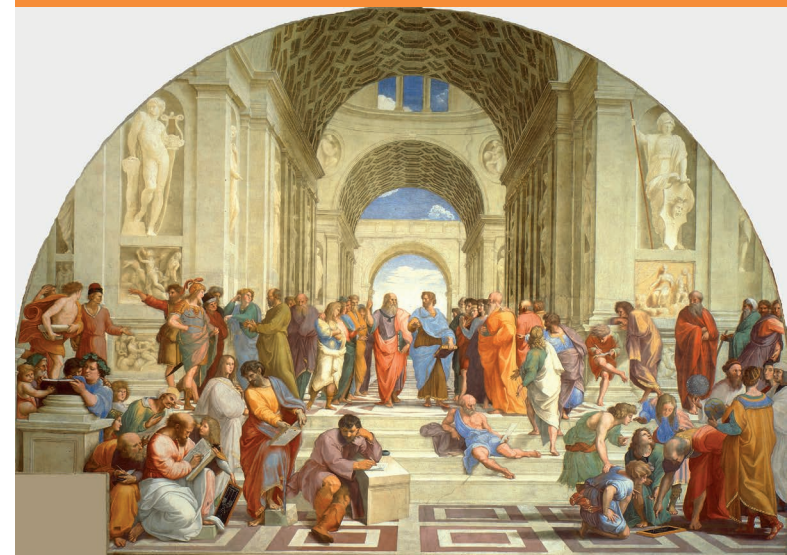
Título de la obra: The School of Athens de Raffaello Sanzio da Urbino

El dialogo, el respeto y la aceptación de las diferencias son elementos fundamentales para el desarrollo de las organizaciones.